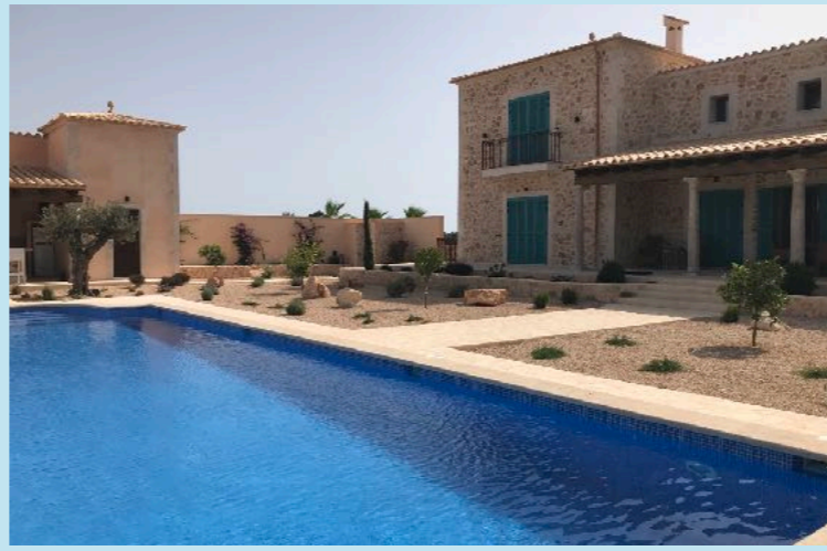
Finca mit angrenzenden Barbecuehaus und Pool