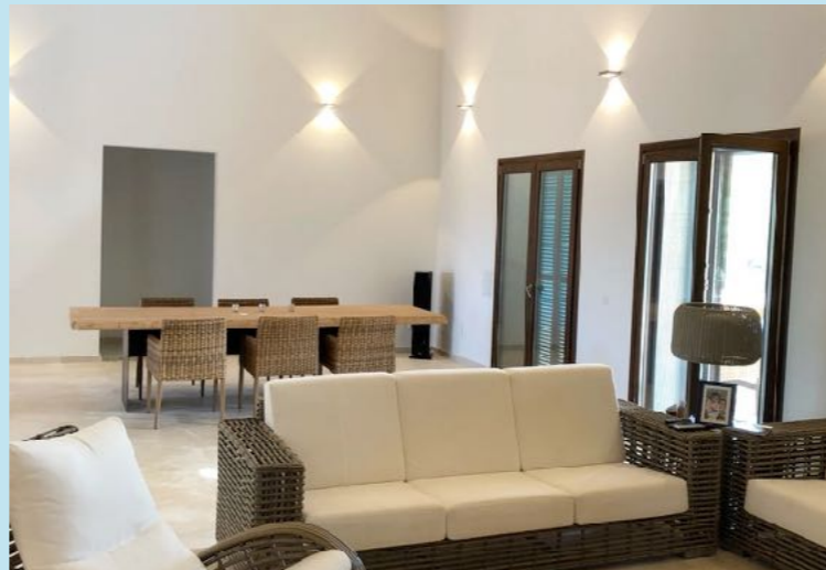
Wohn- und Essbereich in der Finca