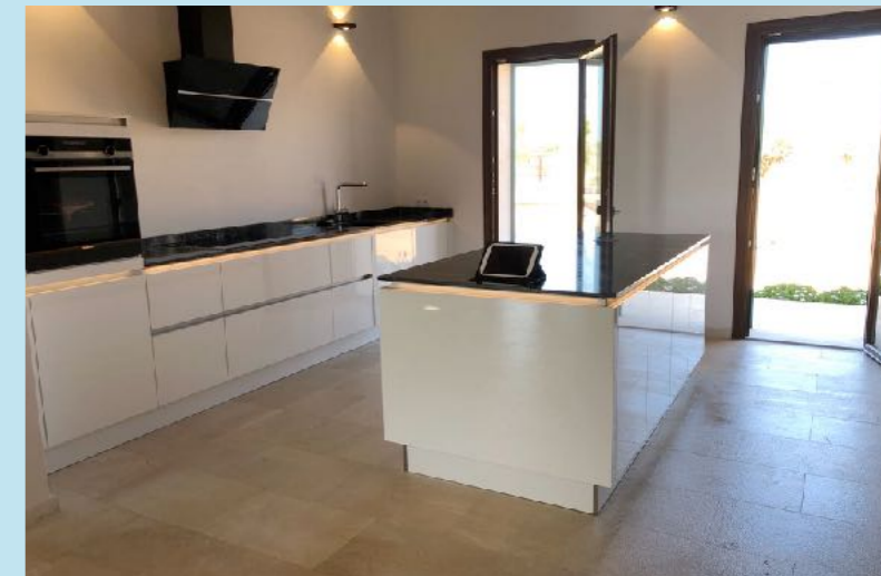
Küche mit allen Extras ausgestattet